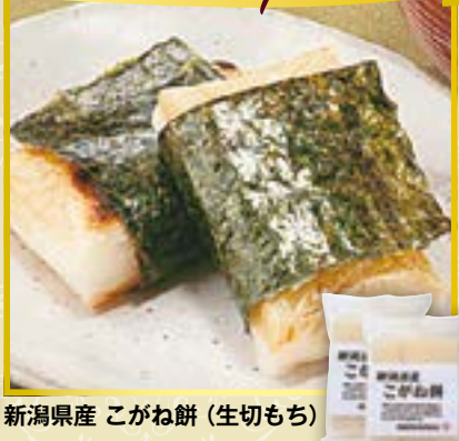
新潟県産 ころね餅 (生切もち)