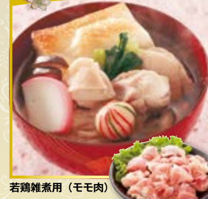
若鶏雑煮用 (モモ肉)