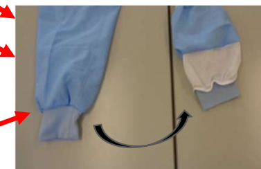
袖口・裾は2重構造