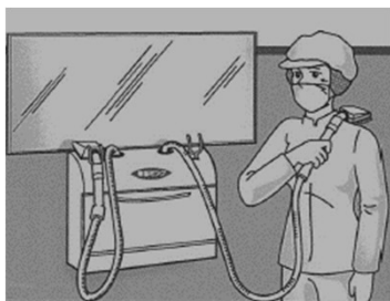
毛髪・塵埃吸引機